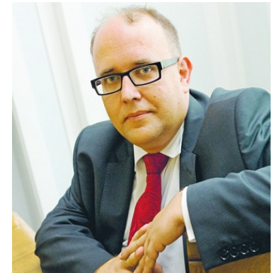
Wojciech Wiewiórowski Stellvertretender EDSB