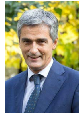
Giovanni Buttarelli EDSB

Der Europäische Datenschutzbeauftragte: Eine unabhängige Einrichtung mit Verantwortung für Die Durchsetzung des Schutzes personenbezogener Daten bei EU Institutionen und Behörden