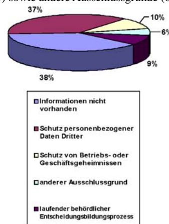
Abb. 4: Ablehnungsgrund

Nach dem Gesetz muss nur offengelegt werden, was bei der Behörde tatsächlich vorhanden ist, und zwar unabhängig davon, ob sie in der Sache zuständig ist oder nicht. Ein weiteres gutes Drittel, nämlich 37 % der Ablehnungsfälle war mit dem Schutz entgegenstehender personenbezogener Daten Dritter begründet. Die restlichen 25 % teilen sich wie folgt auf: Schutz von Betriebs- und Geschäftsgeheimnissen (10 %), laufender behördlicher Entscheidungsbildungsprozess (9%) sowie andere Ausschlussgründe (6%).