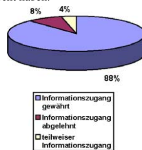
Abb. 3: Erfolgsquote

Die Zahlen sind auch ein guter Beleg dafür, dass sich die Verwaltungen offenbar rasch auf das neue Gesetz mit seiner eingangs dargestellten grundlegenden Neuerung für das Verfahrensrecht einzustellen vermocht haben.