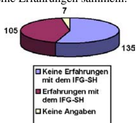
Abb. 1: Erfahrungen mit dem IFG SH

raum gestellt worden. In weiteren nahezu 1.000 Fällen gelangte das IFG-SH zur Anwendung, ohne dass sich die Informationssuchenden ausdrücklich auf das Gesetz berufen hatten. Angesichts der bei einigen Behörden fehlenden Dokumentation ist darüber hinaus eine nicht unbeträchtliche Dunkelziffer zu vermuten. Die Gesamtzahl von gut 2.000 Anträgen zeigt, dass das Gesetz seinen festen Platz in der schleswig-holsteinischen Gesetzeslandschaft gefunden hat, ohne dass es dabei zu dem eingangs befürchteten Ansturm auf die Rathäuser gekommen wäre. Von den rund 250 angeschriebenen Kommunen (Ämter, Städte, Kreise und Gemeinden) hat knapp die Hälfte (105) Bekanntschaft mit dem Gesetz gemacht. 135 Kommunen konnten hingegen noch keine Erfahrungen sammeln.